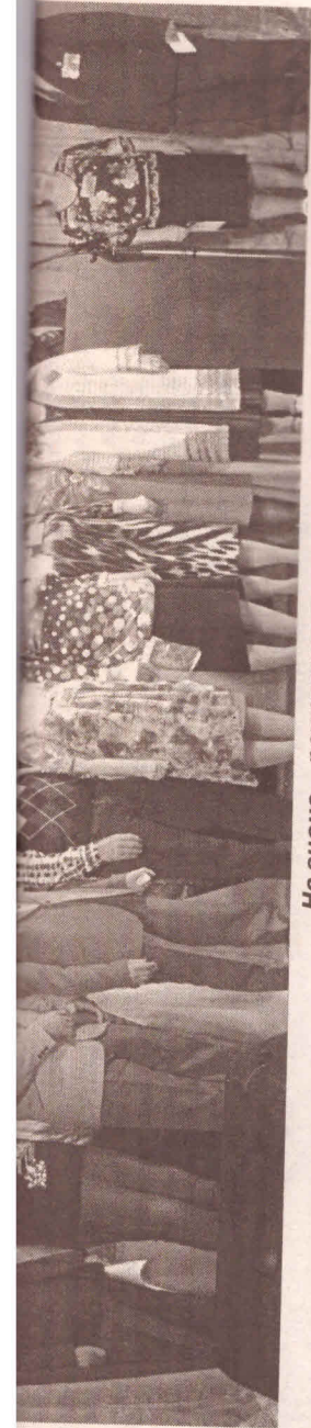
На сцене – режевские поэты.